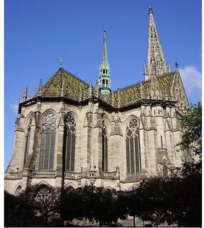
De Gedächtniskirche ingewijd in 1904 herdenkt het protest in Speyer

In 1529 dienden Lutherse koningen en enkele hervormingsgezinde steden tijdens de Tweede Rijksdag in Speyer in Duitsland een Protestatio in, een bezwaarschrift. Het was het officiële protest tegen het intrekken van de eerder verleende vrijheid van geloof. Sindsdien heten zij en allen die na hen kwamen protestanten. Na het ontstaan van het protestantisme, onrust en verwarring Er breken roerige tijden aan in de pasgevormde Nederduits Gereformeerde kerk. Volgelingen van de kerkhervormers Luther en Calvijn verschillen van mening op voor hen essentiële punten en gaan ieder hun eigen weg.