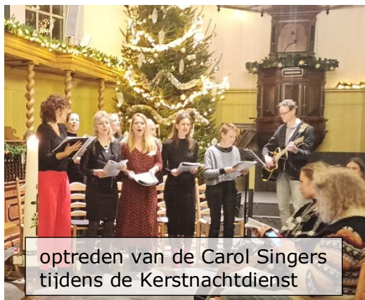
optreden van de Carol Singers tijdens de Kerstnachtdienst

We kunnen terugkijken op mooie diensten met en rond de afgelopen kerstdagen. Een prachtige dienst op 1 e Kerstdag en daaraan voorafgaand de Kerstnacht-dienst. De kerk was goed gevuld en de Carol Singers verleenden hun medewerking. Tijdens het Kinderkerstfeest luisterden de